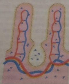
Darm raakt beschadigd door ontstekingsreactie in de slijmvlieslaag.