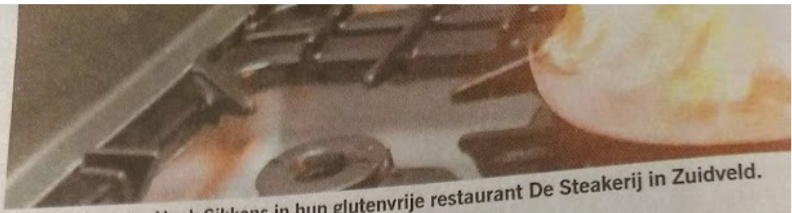
Roelie Knorren en Henk Sikkens in hun glutenvrije restaurant De Steakerij in Zuidveld.

Restaurant De Steakerij in Zuidveld, onder de rook van Westerbork, is sinds kort volledig glutenvrij. Dat is bijzonder: volledig glutenvrije restaurants kent Nederland amper.