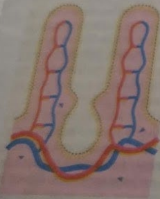
Slijmvlies heeft normaal een sterk geplooide structuur. Gluteneiwit veroorzaakt immunreactie.

Coeliakie Coeliakie (glutenintolerantie) is een auto-immuunziekte waarbij het afweersysteem niet alleen de gluten-eiwitten maar ook de eigen darmcellen beschadigt. Hierdoor kunnen voedingsstoffen niet goed worden opgenomen en treden er tekorten op.